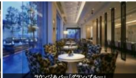
ラウンジ&バー「グラン・ブルー」

熟練の焼き手が目の前でおりなす華麗なパフォーマンスと地元兵庫の新鮮な山海の幸を愉しむひととき。海を見ながらの神戸ビーフはまた格別です。