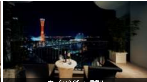
オーシャンビューテラス

全ての客室にJaxon社製の高級ジャグジーバスと浴室TVを完備。神戸の夜景を眺めながら、またはお気に入りの映画を愉しみながら至高のバスタイムを。