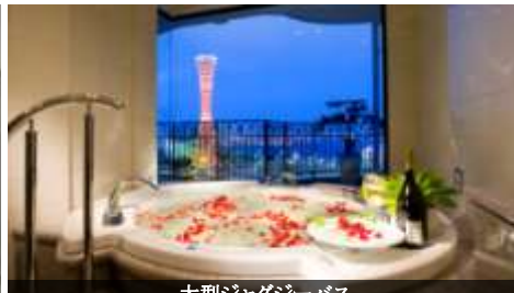
大型ジャグジーバス

「泊まる」というより「暮らす」感覚でお楽しみいただける、広々とした客室と上質なインテリア、そして海への解放感が贅沢なリゾート気分を盛り上げます。