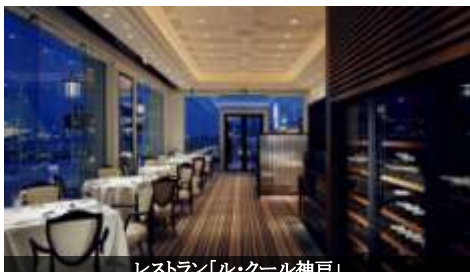
レストラン「ル・クール神戸」

全ての客室が神戸港を望むオーシャンビューテラス付きのラ・スイート。「夜景とワイン」、「昇る朝陽とモーニングコーヒー」など素敵なマリアージュが楽しめます。