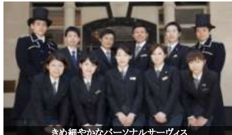
きめ細やかなパーソナルサービス

世界のセレブリティに愛される国際ホテルブランドです。米国富裕層を対象とした Luxury Institute による調査で高級ホテル部門3年連続1位を受賞しました。