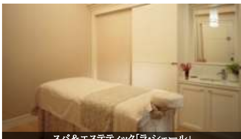
スパ&エステティック「ラ・シェール」

地中海リゾートさながらの解放感と神戸ならではのエレガンスを兼ね備えた大人の空間。スタインウェイの限定モデルピアノが奏でるジャズも毎晩楽しめます。