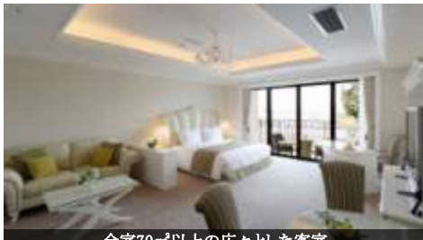
全室70㎡以上の広々とした客室

一步入った瞬間に肌で感じる上質感。大きな看板も出ていないため、まるでヨーロッパの邸宅に入っていくかのような特別な高揚感が身を包みます。