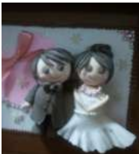
「ウェルカムボード」