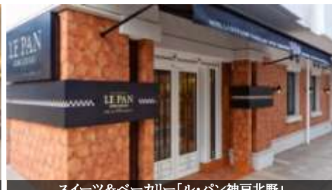
スイーツ&ベーカリー「ル・パン神戸北野」

パリのサロンを思わせるバンケットフロアはあらゆる用途に対応可能。ラ・スイートならではのプライベート感と上質感でお客様をおもてなしいたします。