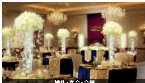
婚礼・宴会・会議

ホテル直営の女性専用サロン。客室階からは専用エレベーターで直行できます。日常の疲れを優しく解きほぐし、心地よい安らぎと癒して五感を解き放ちます。