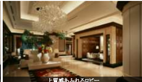
上質感あふれるロビー

ラススイートの一番の魅力は『おもてなし』。セクショナリズムをなくし、全てのスタッフが1人3役以上をこなすことによってスムーズで温かいホスピタリティを実現。