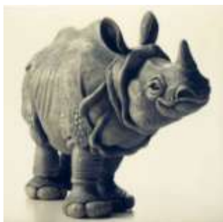
「生き残り印度犀(インドサイ)」